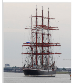
Lütte Sail - Konvoi 2021 nach Bremerhaven

Geführte Bootstour von Oldenburg und Vegesack über die Unterweser nach Bremerhaven