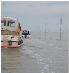
„geführte Wattenfahrten“ 2021

mit eigenem Boot von Wilhelmshaven nach Bremerhaven oder von Bremerhaven nach Wilhelmshaven