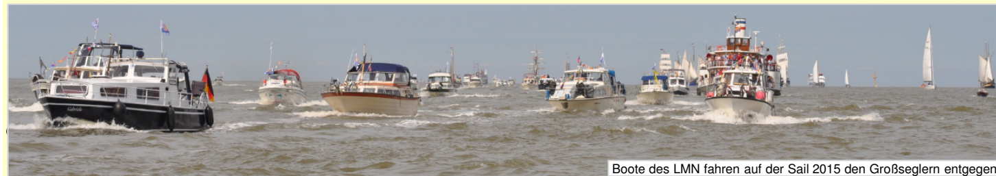
Boote des LMN fahren auf der Sail 2015 den Großseglern entgegen

Die Boote des LMN verlassen am Mittwochmorgen ihren Liegeplatz, passieren die beiden historischen Klappnrücken und die Schleuse und fahren auf der Westseite, neben der Fahrinne (hinter den grünen Tonnen) dem Konvoi der Großsegler entgegen. Sobald sie die Segelschiffe passiert haben, drehen sie bei und folgen diesen. Der LMN Konvoi wird Teilnehmer der Einlaufparade. Nach dem Passieren der Geeste-Einfahrt fährt der Konvoi weiter Richtung Bremen, bis die Schleuse für uns bereit ist. Dann passieren die Boote die Schleuse, nachfolgend die beiden historischen Klappbrücken und machen wieder auf ihrem zugewiesenen Platz im Hafen fest. Ein ganz besonderes Erlebnis ist das Begegnen der historischen Schiffe in unmittelbarer Nähe.