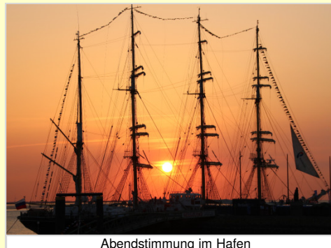
Abendstimmung im Hafen

Hier können Sie den Trubel des Festes, aber auch die Abgeschiedenheit am Ufer der Wesermündung genießen. Nicht nur das große Feuerwerk zum Ende des Festes, sondern jeder Sonnenuntergang hinterlässt hier einen bleibenden Eindruck.