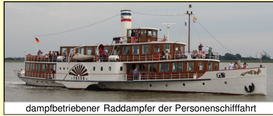
dampfbetriebener Raddampfer der Personenschifffahrt