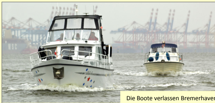
Die Boote verlassen Bremerhaven

Z. Zt. werden die Elbdeiche erhöht und im Zuge dieser Maßnahme wird auch die Schleuse Otterndorf des Hadelner Kanals erneuert. Sie kann während der Bauphase nicht benutzt werden. Diese schöne und sichere Verbindung im Binnenland steht der Schifffahrt vorübergehend nicht mehr zur Verfügung. Um dem Skipper die mehr als 400 Km lange Binnenlandverbindung über den Mittellandkanal oder den Weg über die offene See zu ersparen, möchte der LMN ihnen den Weg über die Watten in Erinnerung bringen und sie hierbei unterstützen. In der Saison 2019 werden einmal pro Monat zeitgleich zwei geführte Wattenmeerfahrten angeboten; eine von Bremerhaven nach Cuxhaven, die andere von Cuxhaven nach Bremerhaven.