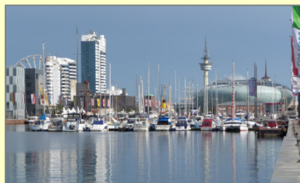
Einer der Yachthäfen in Bremerhaven

Auf dieser Fahrt werden die Teilnehmer sehr schnell feststellen, dass diese Reise durch das Watt ein ganz besonderes Erlebnis sein wird und nicht nur eine Kompromisslösung, auf relativ einfache und sichere Weise das andere Flussrevier zu erreichen. Die Erfahrung, mit auflaufendem Wasser entlang der beprickten Fahrwasser zu fahren, ist deutlich einfacher als landläufig angenommen.