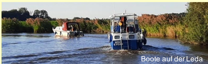
Boote auf der Leda

Der südlichste Hafen ist nach dem Durchfahren des Elisabethfehnkanals in Kamperfehn. Hier beginnt die direkte Anbindung an den Küstenkanal und somit auch an Oldenburg und Dörpen.