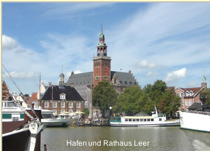
Hafen und Rathaus Leer

Zu diesem Gebiet gehört auch der Elisabethfehnkanal als unersetzliches Baudenkmal der Fehnsiedlungen dieser Region. Einst durchzogen unzählige von Hand gegrabene Kanäle das Gebiet zwischen Ijssel und Weser, um die bis dahin unwegsamen Moore zu erschließen. Nur dieser harten Pionierarbeit ist es zu verdanken, dass diese Landstriche bewohnbar wurden und Ackerflächen geschaffen wurden.