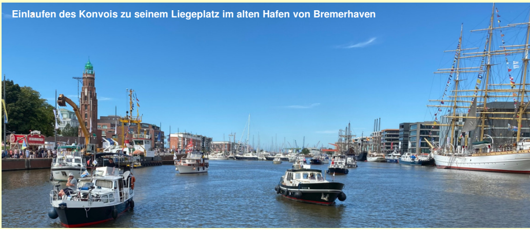
Einlaufen des Konvois zu seinem Liegeplatz im alten Hafen von Bremerhaven

Die maritimen Tage in Bremerhaven, ein maritimer Höhepunkt in der zweiten Hälfte der Bootssaison